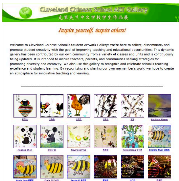
图 4、用信息技术构建学生园地