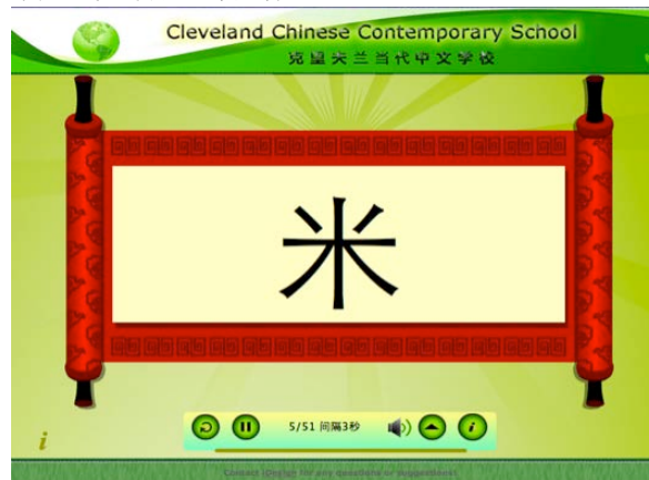
图 2、中文识字比赛软件

为了活跃学习气氛，提高学习兴趣，中文学校每年定期举行各种文化竞赛和比赛，充分运用各种技术促进学校丰富的活动。例如，我们自己开发了一套中文识字比赛软件，并应用到实际的中文识字比赛中。该软件采用计算机随机滚动的出题方式，真正实现了机会均等并考察了学生对汉字的掌握程度。今年，计算机辅助的比赛形式又成功地应用于演讲比赛和文化知识竞赛当中，采取随机选题和现场抢答的方式，既活跃了现场气氛，又考验了学生的应变能力和临场发挥能力。从长远的角度讲，最好的学习不是简单的记忆和反复的练习，而是有意义的活动、在社群中的学习、个性的发挥、和潜能的发展。