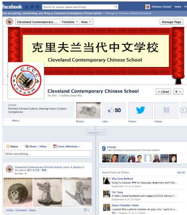
图 3、社群软件促进文化传播

一两年也着手网上信息平台的建设，方便和满足分散各地的家庭查询信息、订购书本等等需求。中文学校的 Facebook 和 Twitter 一经推出，不仅受到家长和老师们广泛的欢迎和关注，更是适应了年轻一代的需要。通过这一平台及广大的支持者群体，中文学校真正构建了一个网络群体，实现了文化辐射，促进了社会交流。