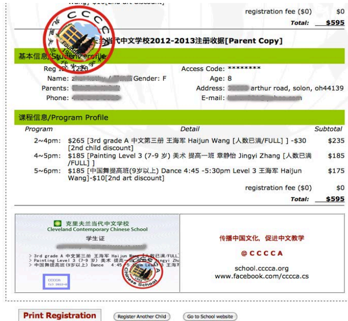
图 1、中文学校电子注册系统