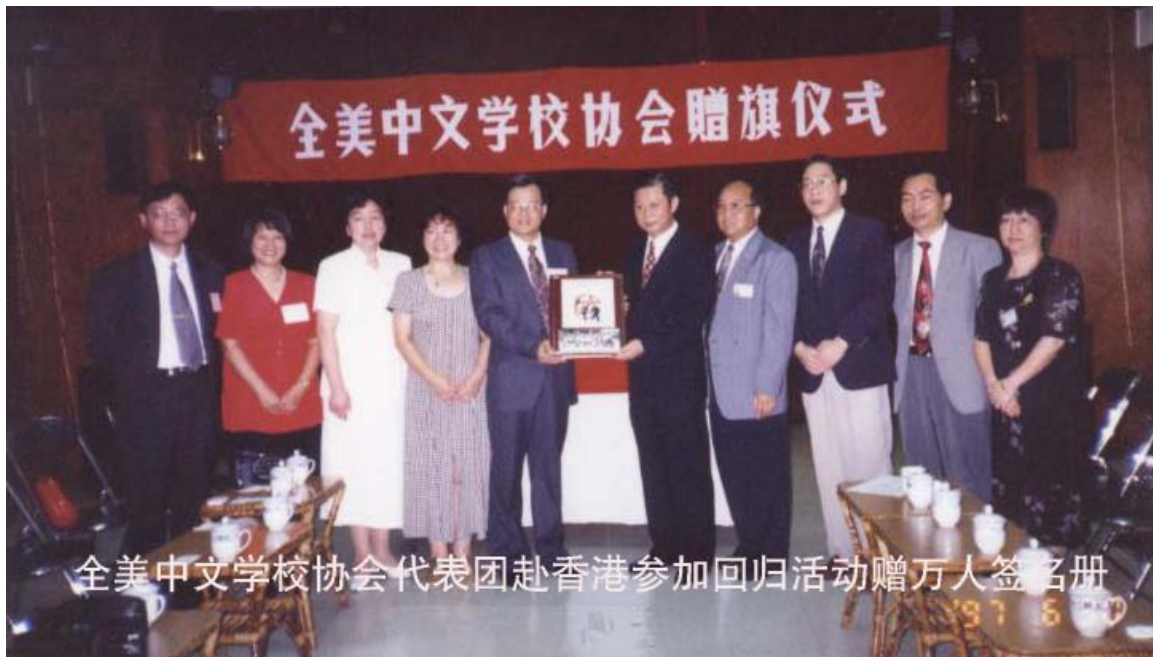
全美中文学校协会代表团赴香港参加回归活动赠万人签名册