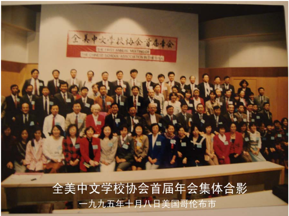
全美中文学校协会首届年会集体合影