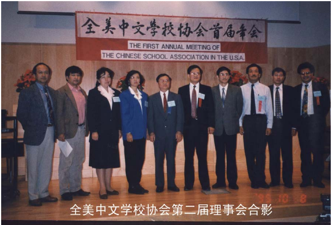
全美中文学校协会第二届理事会合影