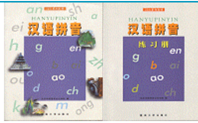
汉语拼音、汉语拼音练习册 [一本书、一本练习]