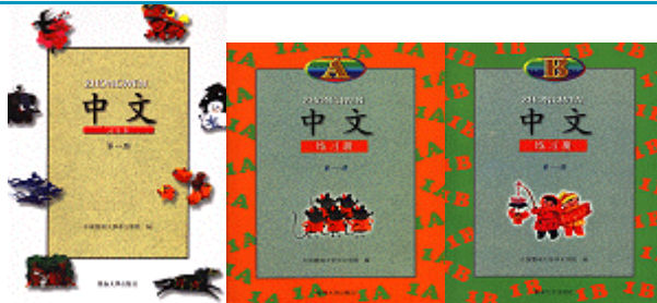
中文教材(1-12册) 中文练习册A(1-12册) 中文练习册B(1-12册)