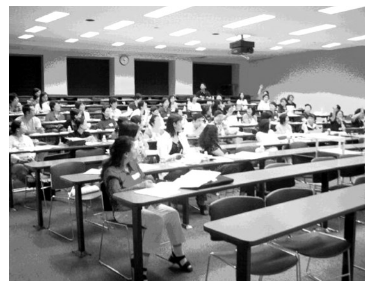
参加交流会的老师们踊跃提问