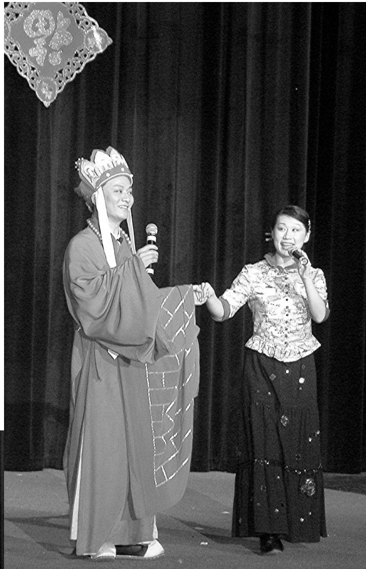
全美中文学校协会 季度通讯

全美中文学校协会 The Chinese School Association in the United States