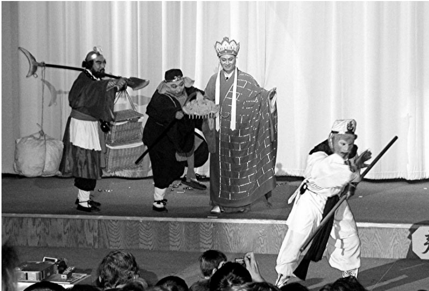
《西游记》剧组及大陆其它演员们春节期间在美国几大城市演出精彩片断

What a celebration we had. The <Journey to West> group performance captivated audiences among our 10 member schools/cities. Their excellent performances helped bring all of us the great golden money's luck!! Enjoy some of the photos of their performances